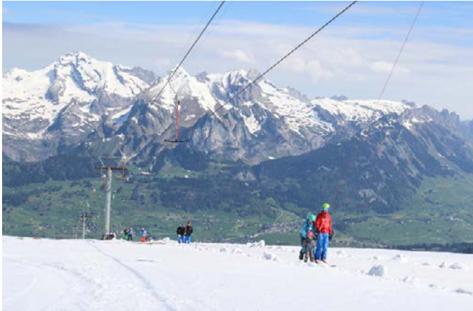
1K4A4913 Bild 04: oben weiss, unten grün.