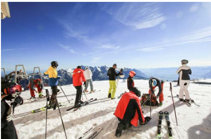
1K4A5342 Bild 01: Sommer Skifahren auf dem Chäserrugg

Bilderauswahl Skifahren am 28. & 29. Mai 2021: Was für ein Sommerstart am Chäserrugg! Download Bildmaterial: https://we.tl/t-MTEVozOTRH