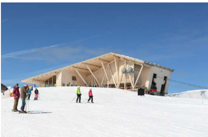
1K4A4759 Bild 03: die Nordabfahrt, vom Winter in den Sommer fahren.