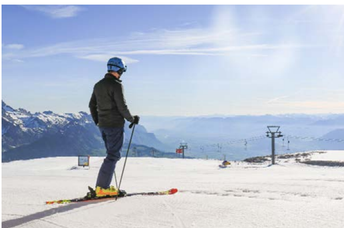
1K4A5291 Bild 02: Als erster auf der Piste, Blick zum grünen Rheintal